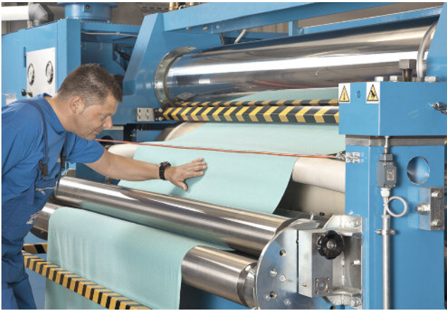
Trans-Textil legt in der Fertigung von Funktionstextilien großen Wert auf hochqualifizierte Mitarbeiter und Anlagen auf dem modernsten Stand der Technik.

Dabei sind ganz klar Zusatzfunktionen gefordert, bei denen wir uns stark an den Rückmeldungen unserer Partner aus der Praxis orientieren. So punkten diese OP-Lamine der höchsten Leistungsstufe überall dort, wo im OP große Mengen an Flüssigkeit anfallen. Hohes Absorptionsvermögen, beschleunigte Trocknung, Bakterienhemmung und Gewichtsreduzierung sind Themen, zu denen laufend verbesserte Produkte entwickelt werden.